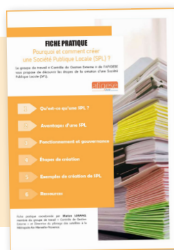
Pourquoi et comment créer une Société Publique Locale ?