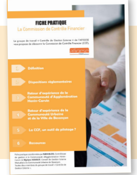
La Commission de Contrôle Financier