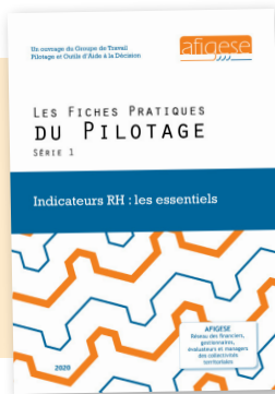
Fiches pratiques du pilotage Série 1 : les essentiels des indicateurs RH