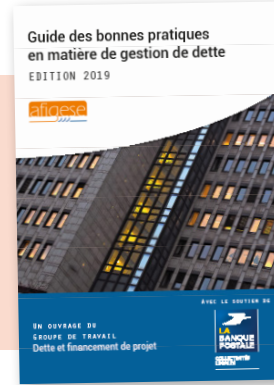
Guide des bonnes pratiques en matière de gestion de dette