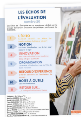
Les Echos de l'Évaluation Supplément à la lettre d'information

Pour en savoir plus, téléchargez les éditos et les sommaires sur le site de l'AFIGESE. Pour les commander et connaître les tarifs, téléchargez les bons de commandes en ligne sur : www.afigese.fr