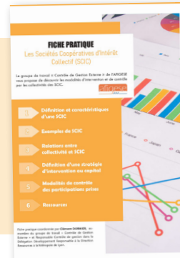
Les Sociétés Coopératives d'Intérêt Collectif