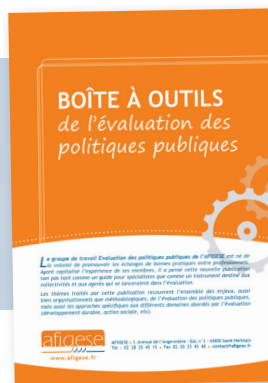
Boîte à outils de l'évaluation des politiques publiques Classeur d'une trentaine de fiches