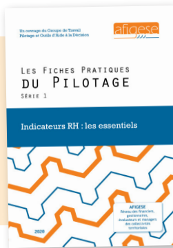
Fiches pratiques du pilotage Série 1 : les essentiels des indicateurs RH