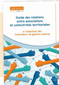
Guide des relations entre associations et collectivités territoriales