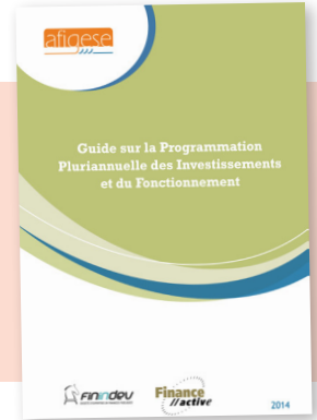
La programmation pluriannuelle des investissements et du fonctionnement