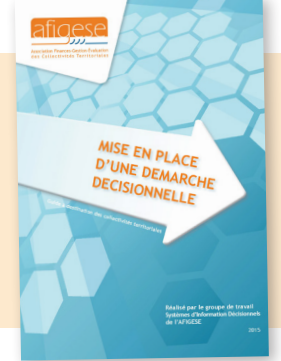
Mise en place d'une démarche décisionnelle