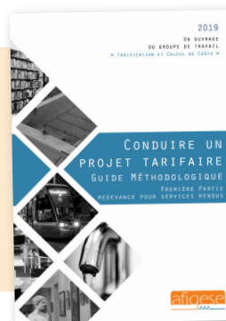
Conduire un projet tarifaire : redevance pour services rendus