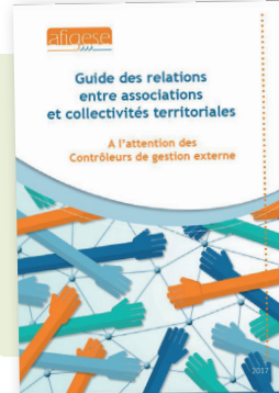
Guide des relations entre associations et collectivités territoriales