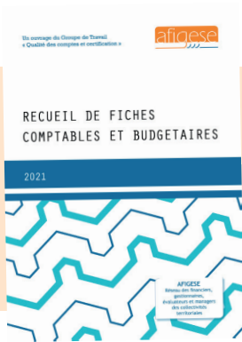
Recueil de fiches comptables et budgétaires