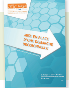
Mise en place d'une démarche décisionnelle