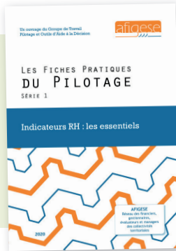
Fiches pratiques du pilotage Série 1 : les essentiels des indicateurs RH