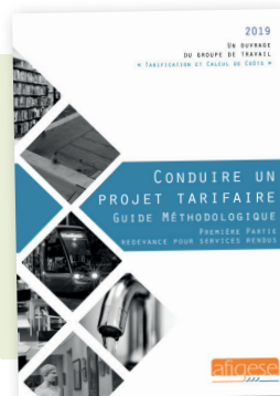
Conduire un projet tarifaire : redevance pour services rendus