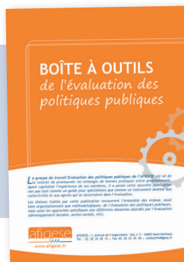
Boîte à outils de l'évaluation des politiques publiques Classeur d'une trentaine de fiches