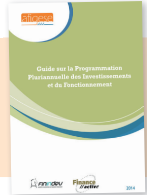
La programmation pluriannuelle des investissements et du fonctionnement