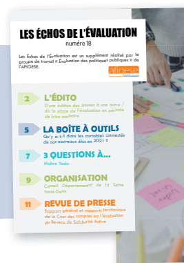
Les Echos de l'Évaluation Supplément à la lettre d'information

Pour en savoir plus, téléchargez les éditos et les sommaires sur le site de l'AFIGESE. Pour les commander et connaître les tarifs, téléchargez les bons de commandes en ligne sur : www.afigese.fr