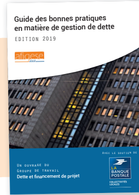
Guide des bonnes pratiques en matière de gestion de dette